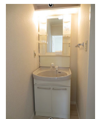
シャブードレッサー